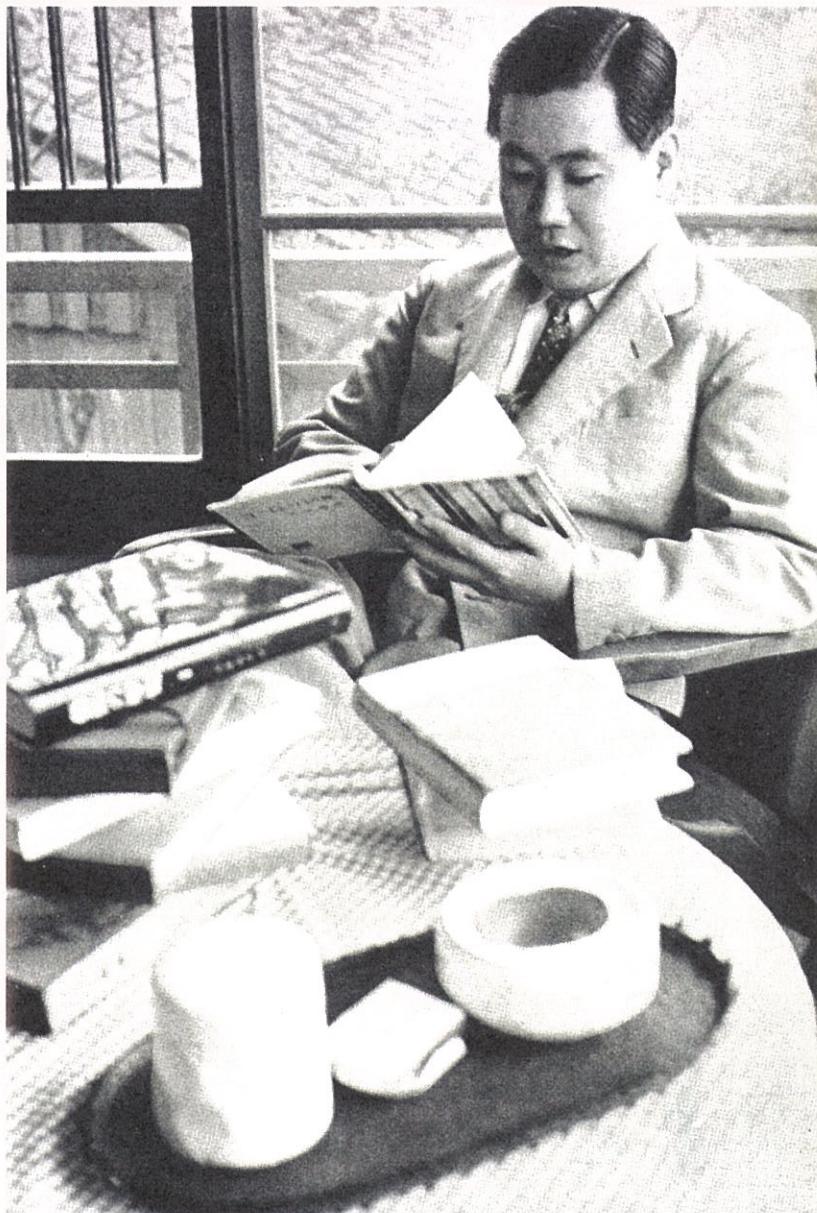
読書する岩淵先生（昭和33年ごろ）

1928年大連に生まれる。9歳よりヴァイオリンを始め、ヴィリー・フライに師事。1939年第8回毎日音楽コンクールにおいて第二位入賞。その後第一高等学校を経て、東京大学法学部へ入学。在学中の1949年に日本交響楽団（現NHK交響楽団）に入団、翌年にはコンサートマスターに就任し、1956年に退団するまでその任にあった。1953年にプロムジカ弦楽四重奏団を結成、翌年シェーンベルク作品の演奏により毎日音楽賞を受賞する。1962年にはベートーヴェンの弦楽四重奏曲全曲を演奏し、「日本に本当のクワルテットが誕生した」（菅野浩和）など賞賛を博して、同年度の芸術選奨を受けた。また神戸室内合奏団音楽監督・常任指揮者も務める。1961年、桐朋学園大学助教授に就任して以来、後進の育成にも力を注いだ。翌年、京都市立音楽短期大学教授。京都市立芸術大学音楽学部創設にも尽力し、1969年よりは同大学教授。1993年に定年退官後、1995年より京都コンサートホール初代館長（～2003年）に就任、その後も京都を中心として音楽文化の発展に寄与する。脳梗塞を発症し、治療を続けていたが、2016年1月5日呼吸不全のため死去。日本弦楽指導者協会名誉会員。1990年京都市文化功労者として表彰されたほか、勲三等旭日中綬章、ポーランド共和国文化功労勲章を受章。