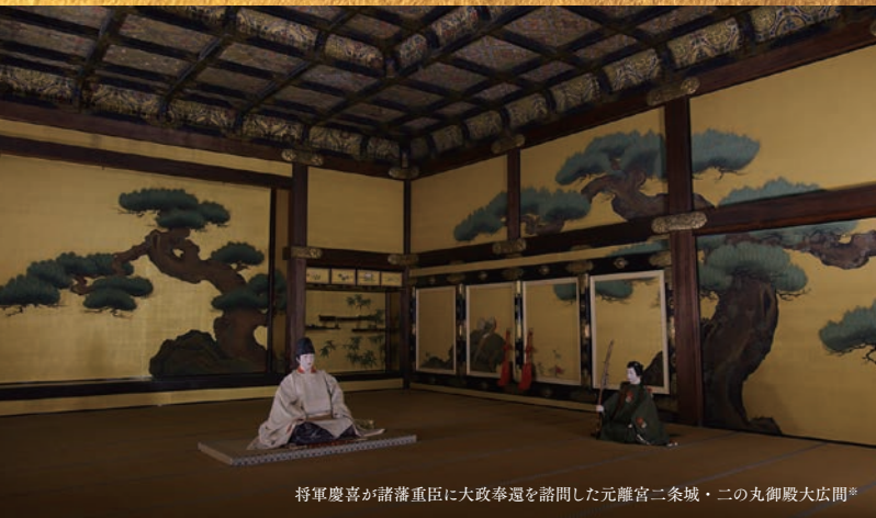
将軍慶喜が諸藩重臣に大政奉還を諮問した元離宮二条城・二の丸御殿大広間*