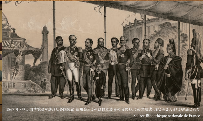
1867年パリ万国博覧会を訪れた各国使節 徳川幕府からは将軍慶喜の名代として弟の昭武(右から2人目)が派遣された

時代の大きな転換点となった1867年。国内では大政奉還が行われ、かたやヨーロッパでは日本がはじめて参加したパリ万国博覧会が開催されました。日本の出品作品はヨーロッパで大きな反響を呼び、その6年後の1873年ウィーン万国博覧会と併せて、「ジャポニスム」は一大ブームを巻き起こしました。京都市交響楽団コラボレーションイベント『時の響』は、150年前、日本と西洋の文化が出会ったその歴史を、音楽と映像、食で旅する新しい趣向の文化体験イベントです。パリ万国博覧会やウィーン万国博覧会の時代に活躍したビゼーやJ.シュトラウスIIなどの作曲家の中から選りすぐりの作品を演奏し、その時代の空気感を感じていただくとともに、大政奉還の舞台となった元離宮二条城の高精細4K映像の上映や、和食文化の中心を担ってきた京都の料理人による特別おつまみ弁当(限定事前予約制)をお楽しみいただけます。