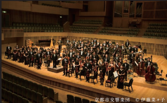
京都市交響楽団