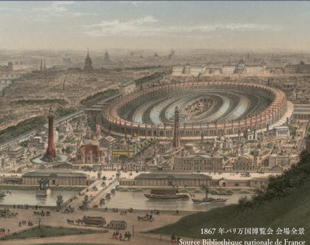
1867年パリ万国博覧会 会場全景