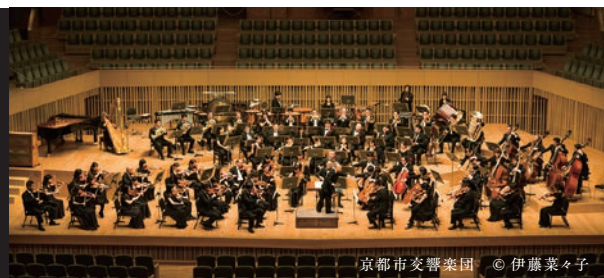
京都市交響楽団