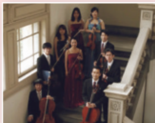
アンサンブル・セリオソ (弦楽合奏)