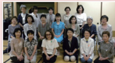
青葉コーラス (合唱)