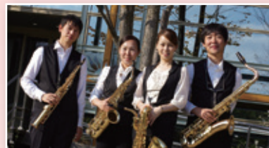
Coco Saxophone Quartet (サクソフォン四重奏)