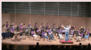
紫野ウインドアンサンブル (吹奏楽)

一般公募で選ばれた8団体が、京都コンサートホール アンサンブルホールムラタのステージ演奏します。 プロ・アマ、音楽ジャンル問わず奏でられる音楽のリレー！さあ、みんなでバトンを受け取りましょう！ どなたでもご自由にお聴きいただけます。