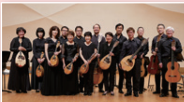
ENSEMBLE L (マンドリン・アンサンブル)