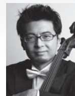
北口 大輔 (チェロ)

日本音楽コンクール第1位「松下賞」受賞。ドイツ国家演奏家資格を取得しベルリン芸術大学を卒業。著名な音楽祭、メディアにも多数出演。2008年より毎年バッハ無伴奏チェロ組曲全曲演奏会を開催。京都市芸術文化特別奨励者及び京都府文化奨励賞受賞。齋藤秀雄メモリアル基金賞受賞。