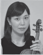
相本 朋子 (ヴァイオリン)

京都出身。桐朋学園音楽学部演奏学科(古楽器専攻)卒業。これまでヴェルサイユおよびパークレーの古楽音楽祭、ウィグモア・ホール、ライプツィヒ・バッハ・フェスティバル2003から招聘されている。K.ギルバートやB.ファン・アスペンとともに「世界の9人のチェンバリスト」にも選ばれた。1999年にはコレギウム・ムジクム・テレマンを見事に率い、オーケストラのディレクターとしての才能を国際的にアピール。2009年度には『パーセル作品集』にて第47回レコードアカデミー賞(音楽史部門)に輝いた。京都市立芸術大学、名古屋音楽大学等で後進の指導にも励んでいる。