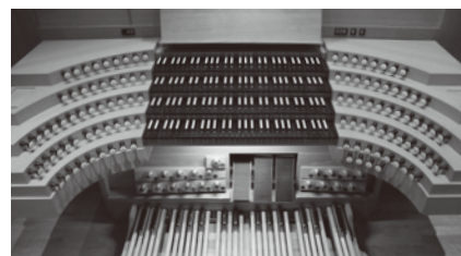
90ものストップ(音色)を備える演奏台