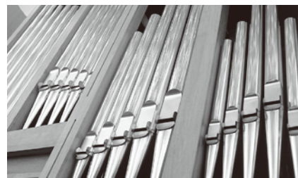
ずらりと並ぶパイプは総数7,155本