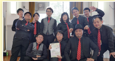
猪名川グリークラブ。(男声合唱)

RESNIK & YOUNG：Under the Boardwalk (港のボードウォーク) 清水精作曲／堀口大樹作詞：「月光とピエロ」より「秋のピエロ」 宮沢和史作詞・作曲／多胡淳編曲：「島唄」 ビリー・ジョエル作詞・作曲・編曲：The Longest Time