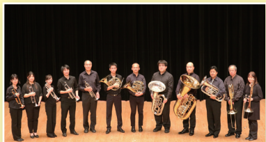
ブラス アンサンブル サタデー Brass Ensemble Saturday (金管アンサンブル)

一般公募で選ばれた8団体が、京都コンサートホール アンサンブルホールムラタのステージで演奏します。 プロ・アマ、音楽ジャンル問わず奏でられる音楽リレー！さあ、みんなでバトンを受け取りましょう！ どなたでもご自由にお聴きいただけます。