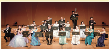
関西フルートオーケストラ (フルートオーケストラ)

アレンスキー：2台のピアノのための組曲第2番 「シルエット」作品23 より 1. 学者 2. コケットな女 5. 踊り子