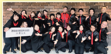
洛和会京都混声合唱団 ハモリス (混声合唱)

ベッリーニ：6つのアリエッタより「どうぞ、いとしい人よ」 オペラ《清教徒》より「あなたの優しい声が」