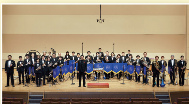
京都ブラスバンド (英国式ブラスバンド)

プーランク：3つのノヴェレット ショパン：ポロネーズ第6番 変イ長調 op.53