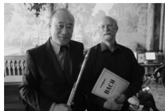
工藤重典(フルート)・リチャード・シーゲル(チェンバロ)

日本を代表するフルート奏者、工藤重典と長きにわたりデュオを組んできた名チェンバリスト、リチャード・シーゲルは、“黄金のデュオ”と称され、CDでも名演を残してきました。工藤重典のやわらかな感性から生まれる美しい音色とシーゲルの知的で洗練された感性の融合こそが、“黄金のデュオ”と呼ばれる秘密です。インスピレーションに満ち溢れ、細部に至るまで息のあった音楽で、17・18世紀のバロック/古典時代へタイムスリップ。フルートとチェンバロ、ふたりの名手による崇高なる一夜となるでしょう。