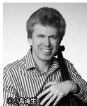
ミハル・カニユカ [チェロ]

“弦の国チェコ”が誇るチェリストであり、名門プラジャーク・クワルテットのメンバーとして世界を舞台に活躍するミハル・カニユカが奏するのは、ロマン溢れるシューマンとラフマニノフの名曲の数々。4本の弦から紡ぎ出される豊潤で暖かな音色、緻密な音楽は我々の心を奪い、そして至高の世界へと導いてくれることでしょう。共演者には、ウィーンで学び中欧の伝統に精通したピアニスト三輪郁を迎えます。近年さらに円熟味を増すカニユカによる至福の一夜をご堪能ください。