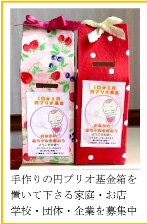
手作りの円ブリオ基金箱を置いて下さる家庭・お店・学校・団体・企業を募集中