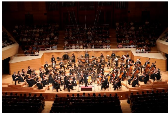
（東京公演（サントリーホール））