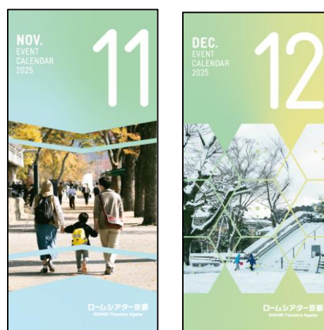
イ 催物カレンダー