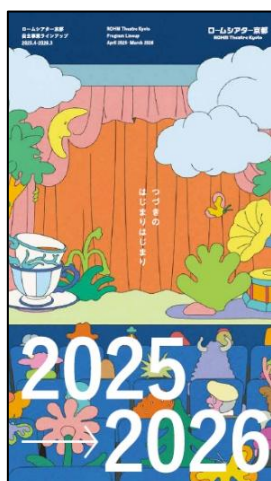
ア 主催事業ラインアップ・リーフレット

ロームシアター京都が自ら企画する主催・共催事業のほか、ロームシアター京都で開催される最新の催物情報を掲載したものを毎月発行し、催物情報の提供やチケット販売促進に努めました。