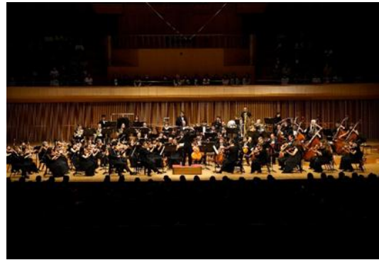
（福井公演：ハーモニーホールふくい）

アウトリーチ事業では、これまで京響を支えてくださった市民の皆様への感謝を込め、京都ならではの伝統文化・近現代文化を体現する趣のある空間でアンサンブル演奏をお届けする「京（みやこ）の音楽会」を開催しました。京都市役所正庁の間を皮切りに、西陣織会館など計4施設で実施しました。