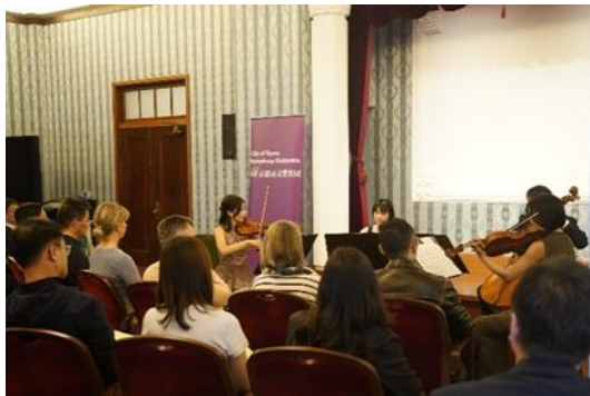
（京都市役所正庁の間）

アウトリーチ事業では、これまで京響を支えてくださった市民の皆様への感謝を込め、京都ならではの伝統文化・近現代文化を体現する趣のある空間でアンサンブル演奏をお届けする「京（みやこ）の音楽会」を開催しました。京都市役所正庁の間を皮切りに、西陣織会館など計4施設で実施しました。