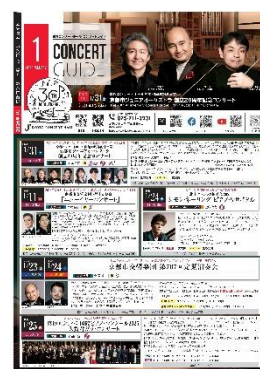
ア 主催事業ラインアップ・リーフレット