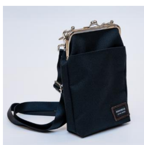
30周年記念グッズ (抜粋)